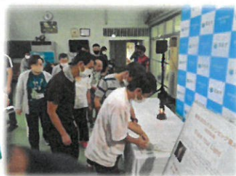
市長さんと一緒に記念撮影📷