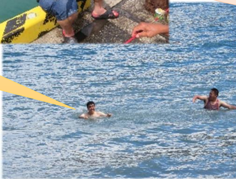
気持ちいい〜っ！ 久しぶりの海水浴