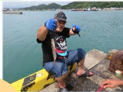
「つかわき2班キャン in 栄松 2023」